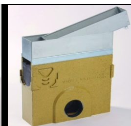
Revizijski element na zbiralniku