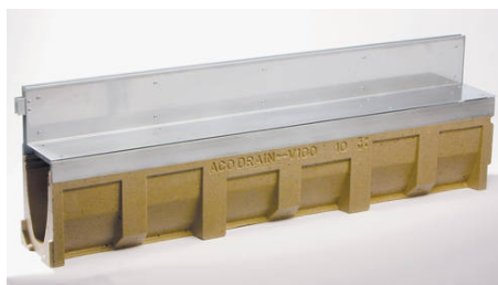
Kanaleta z nastavkom z rego

ACO Slotline je sistem za odvodnjavanje z rego sestavljen iz kanalete in nastavka z rego.