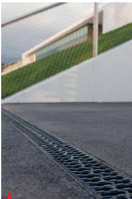
Linijski požiralnik ACO Drain Multiline z litoželezno pokrivno rešetko zaščiten s KTL premazom proti koroziji.

Fasadna opna je razpeta med horizontalno geometrijo betonskih vencev in poudarjenimi