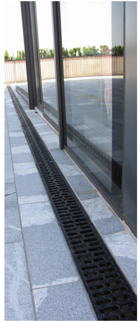
Odvodnjavanje vode s terase in fasade

Poslovne prostore dopolnjujejo programi namenjeni sproščnemu, manj uradnemu druženju poslovnežev, ter velika kongresna dvorana, ki ob možnosti obiska vrhunske restavracije in panoramske kavarne v najvišjem, 20. nadstropju povezuje poslovnost z družabnostjo in užitek uobja popolnosti.