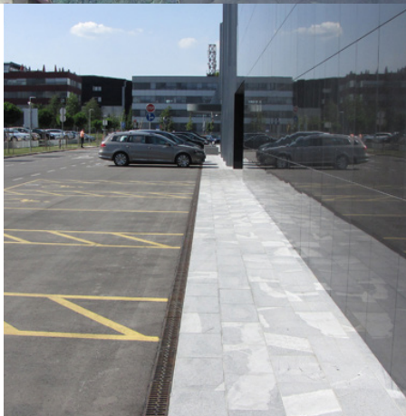
ACO Drain Linjski požiralniki za odvodnjavanje parkirišča pred objektom

Celoten objekt je energetsko varčno naravn. Za prijetno počutje uporabnikov je namenjenih 2.500 kvadratnih metrov zelenih površin na terasi, pred vhodom v palačo pa stoji tudi fontana. V kletnih garažah je zagoto-