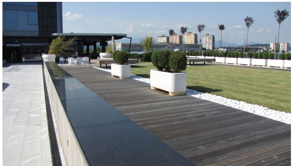
Odvodnjavanje padavinskih vod na terasi z ACO Drain Multiline

Udobno in sodobno oblikovani pisarniški prostori zagotavljajo profesionalno delo na najvišji ravni. Estetika, dobro počutje, energetska učinkovitost in visoki okoljski standardi so tista vodila, po katerih so zasnovani delovni ambienti, ki na uporabnike učinkujejo tako, da je njihovo ustvarjanje in bivanje v njih karseda nemoteno, sproščeno in svetlo.