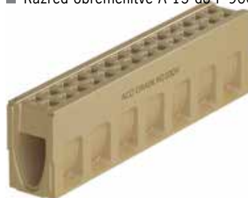
ACO DRAIN® Monoblock RD natur