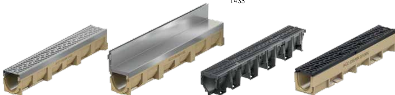
ACO DRAIN® Multiline