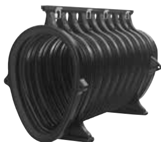
ACO DRAIN® Qmax 900