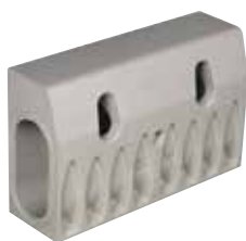
ACO DRAIN® KerbDrain HB 305