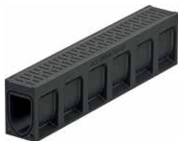
ACO DRAIN® Monoblock PD antracit