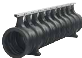
ACO DRAIN® Qmax 350