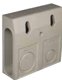
ACO DRAIN® KerbDrain HB 480