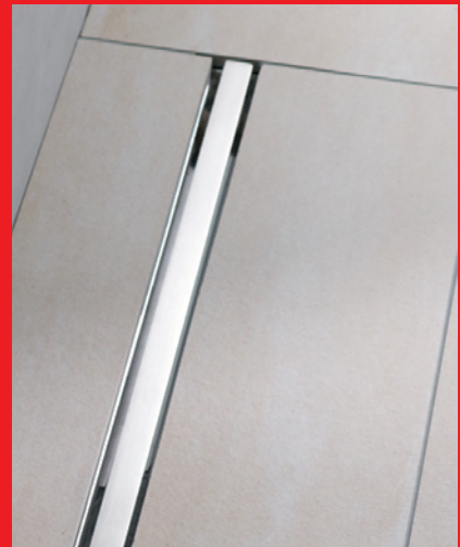
Velika količina pretoka do 0,8 l/s

Tuš kanaleta ACO Showerdrain S izdelana iz nerjavečega jekla se kot diskretna reža v tleh tuša odlično poda vsakemu kopalniškemu ambientu ter hkrati skrbi za zanesljivo odvodnjavanje prostora za tuširanje. ACO Showerdrain S združuje design in funkcionalnost v enem.