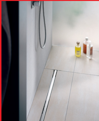
Najnižja višina vgradnje samo 55 mm