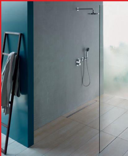
Pokrivna rešetka - ozek pokrov širine samo 2 cm