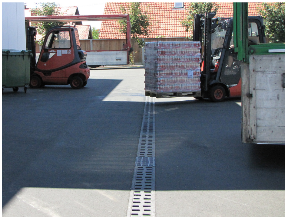
Linijski požiralnik pred vhodom v skladiščne prostore, je zaradi prevozov z viličarji dnevno izpostavljen ekstremnim obremenitvam.

Objekt: Distribucijski center Celje Lokacija: Celje Investitor: Pivovarna Laško Izvedba: 2007