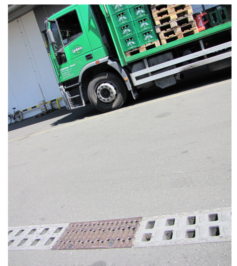
Monoblock RD200V z zbiralnikom s snemljivo litoželezno pokrivno rešetko preko katere pristopamo v notranjost kanalete.

Leta 2013 oz. 6 let od kar je objekt v uporabi na ACO Monoblock kanaletah ni videti nikakršnih znakov poškodb.