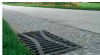
ACO cestni požiralnik