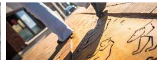
ACO ulična rešetka iz Cortena