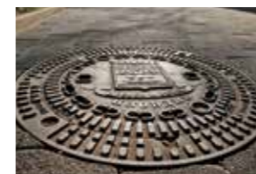
ACO kanalizacijski pokrovi