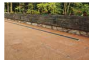
ACO pokrovi za različne vrste tlakov