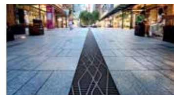
ACO Freestyle pokrivne rešetke