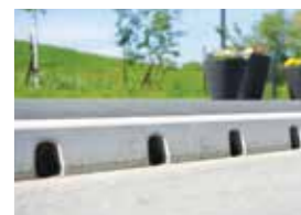
ACO Kerbr drain