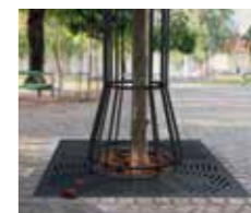
ACO drevesne rešetke