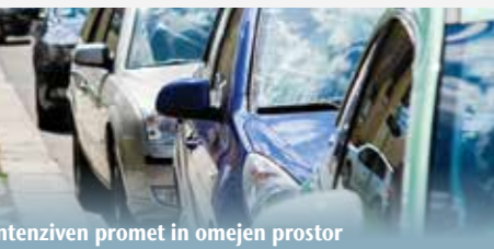
Intenziven promet in omejen prostor