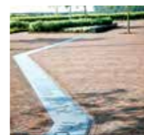
ACO odvodnjavanje z rego