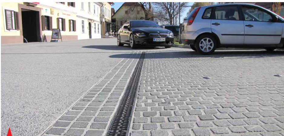
ACO Multiline linijski požiralnik z litoželezno rešetko