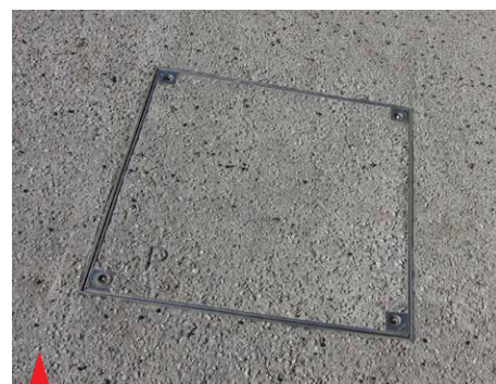
ACO Toptek - pokrov za revizijske jaške po vgradnji.