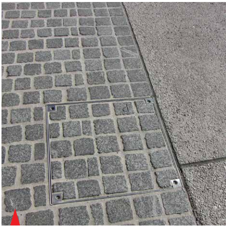
ACO Toptek pokrov za zapolnitev s poljubnim zaključnim tlakom

razvojnih potencialov za obdobje 2007-2013, razvojne prioritete »Razvoj regij«, prednostne usmeritve »Regionalni razvojni programi«.