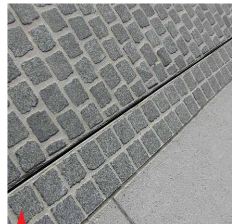
Skoraj neopazna rega

Objekt: Prenova starega mestnega jedra Žalec Investitor: Občina Žalec Projekt: Savinjaprojekt GIZ, Razvojni center planiranje d.o.o. Izvajalec: AGM Nemec d.o.o. Vrednost investicije: 3 mio. € Izvedba: 2013/2014