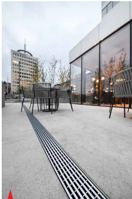
Enotna dizajnerska pokrivna rešetka se pojavlja tako pri odvodnjavanju okolice kot terase in fasade.