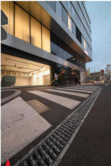
Odvodnjavanje okolice z Monoblock linijskimi požiralniki.